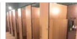
◆ シャワーブース(女性)