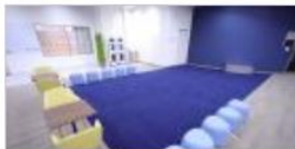
◆ ストレッチエリア