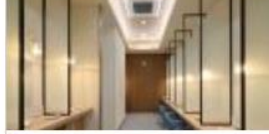
◆ パウダールーム(女性)