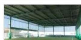
◆ 屋根付きフィットサルコート(テニスコート)