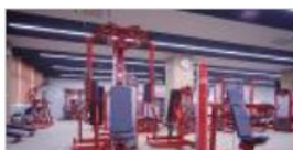
◆ フィットネスエリア