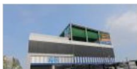
◆ 東急スポーツオアシス習志野24Plus