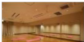
◆ ホットスタジオ(女性専用)