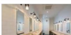
◆ パウダールーム(男性)