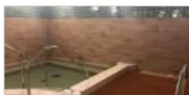
◆ 炭酸泉・人工温泉(女性)