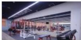
◆ フリーウェイトエリア